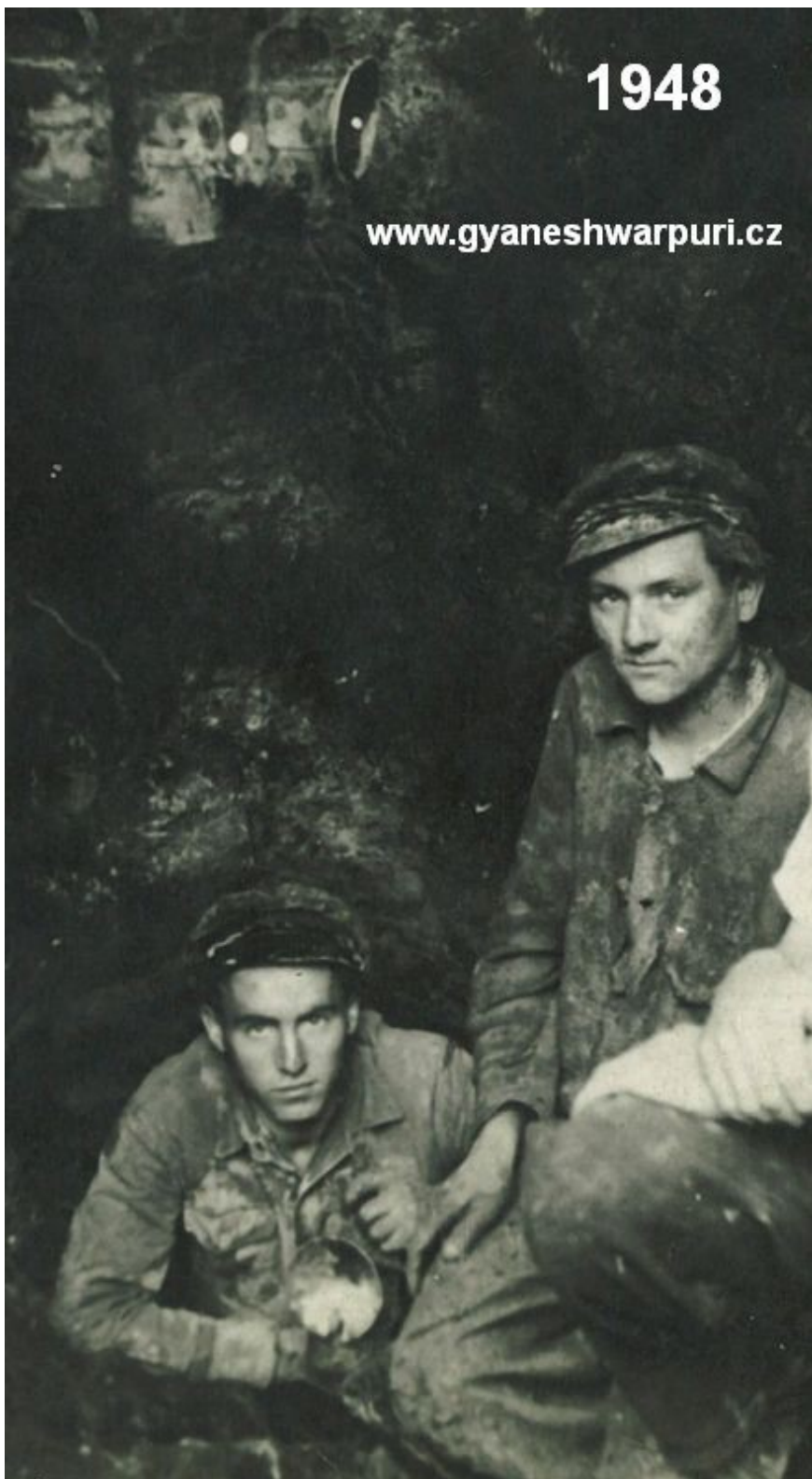
Objev jeskyně Arnoštka ve Křtinském údolí