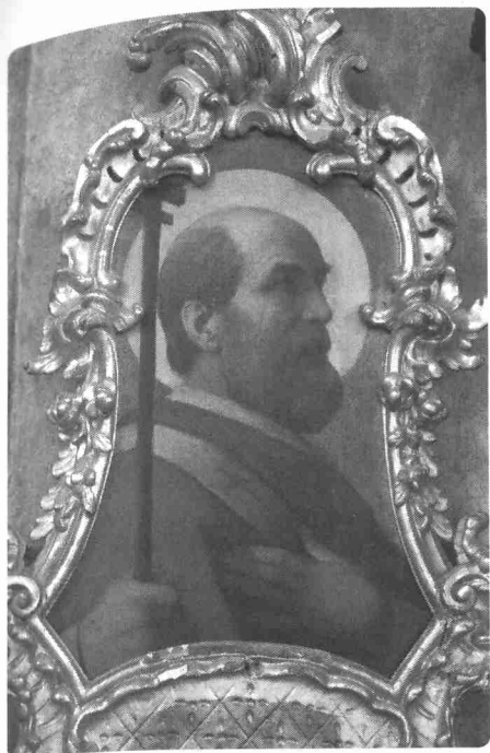
Svatý Metoděj. Foto autor