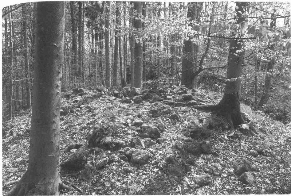
„Hlavní“, nejčitelnější stavba Hrádku u Babic ukryvala místnost o půdorysu cca 2,5 × 2 m. Jedná se zbytek poustevny?