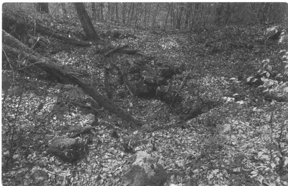
Deprese v příkopu, která je považována za zasypanou studnu. Může však jít i o malý krasový propad.