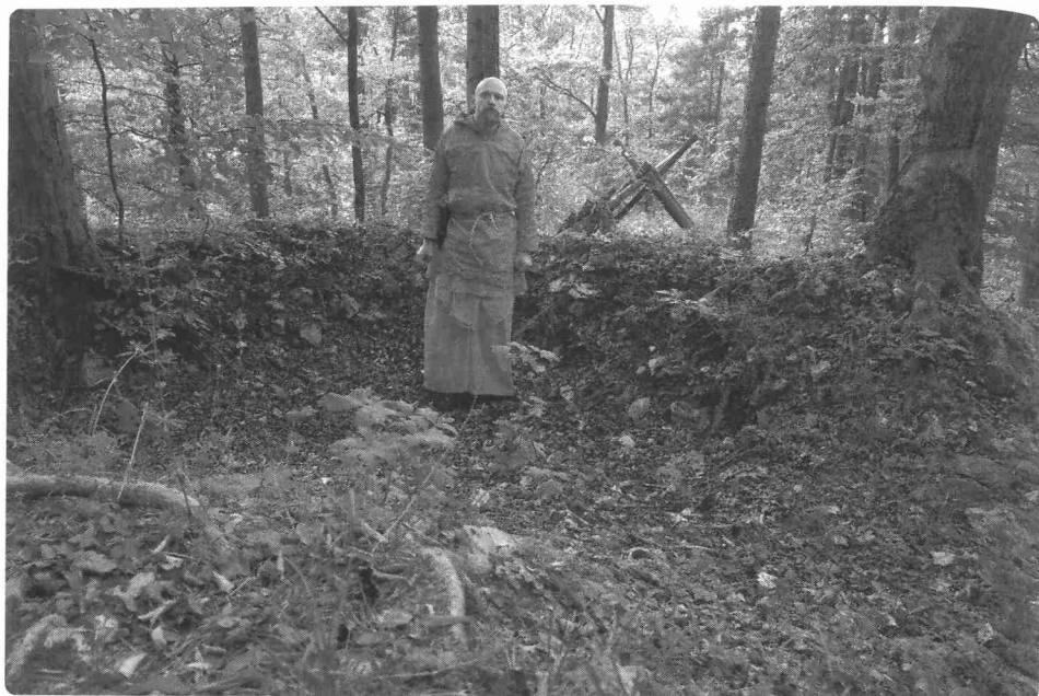
Zbytky druhé stavby.