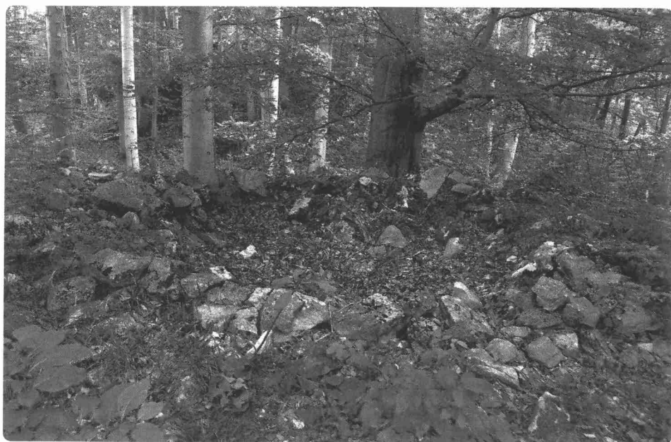
„Hlavní stavba“ u příkopu. Její nejčitelnější zbytky. Celkový pohled. Předcházel objekt ve Křtinském údolí přímo vzniku Křtin?