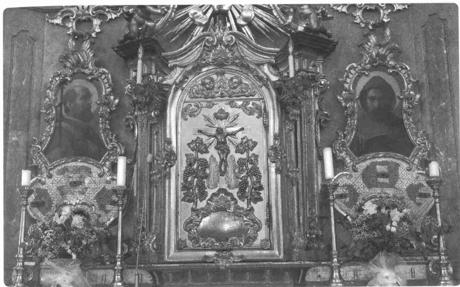
Obrázky sv. Cyrila a Metoděje na hlavním oltáři chrámu Panny Marie ve Křtinách. Jsou tedy Křtiny založeny na cyrilometodějském základě, nebo je to barokní romantická legenda?